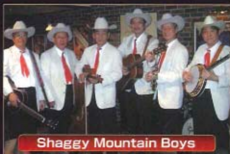
Shaggy Mountain Boys