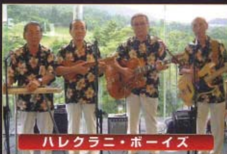
ハレクラニ・ボーイズ